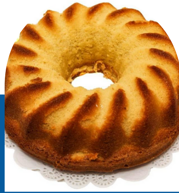
ROSCA DE ARROZ