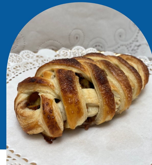
STRUDEL DE MANZANA