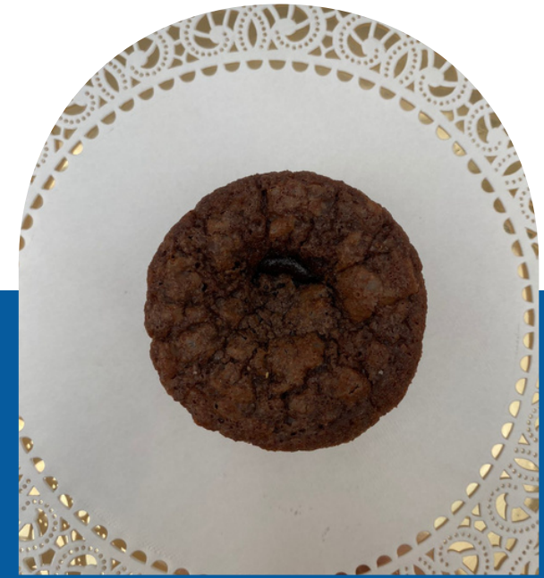
VOLCÁN DE CHOCOLATE