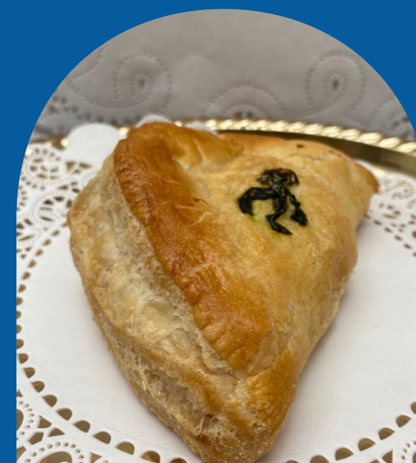
EMPANADA DE QUESO CON ESPINACA