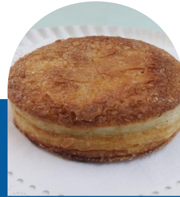
DISCO RELLENO DE CREMA PASTELERA