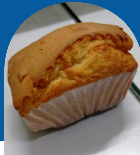
PANQUÉ DE NATA INDIVIDUAL