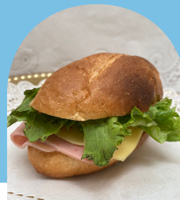
TORTA DE JAMÓN Y QUESO