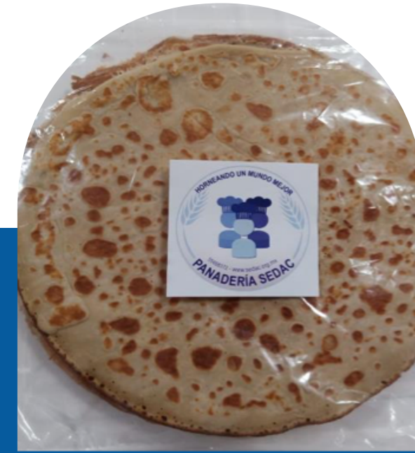
BOLSA DE 10 CREPAS