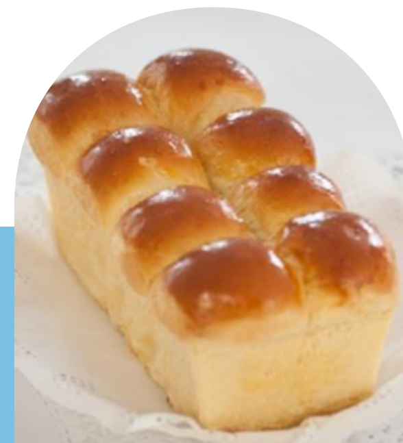
BRIOCHE DE CAJA