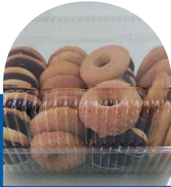
DOMO DE DONITAS