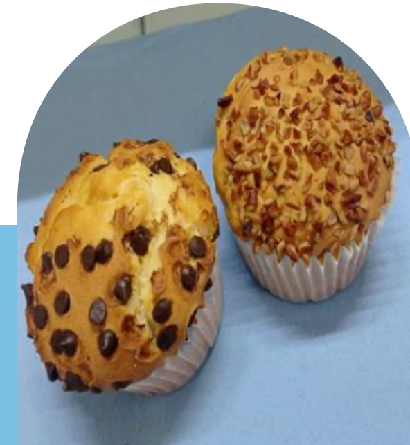
MUFFIN DE CHISPAS O NUEZ