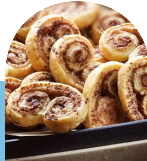
OREJITAS CON NUTELLA