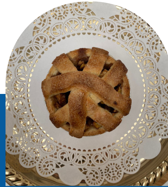
PIE DE MANZANA O PIÑA