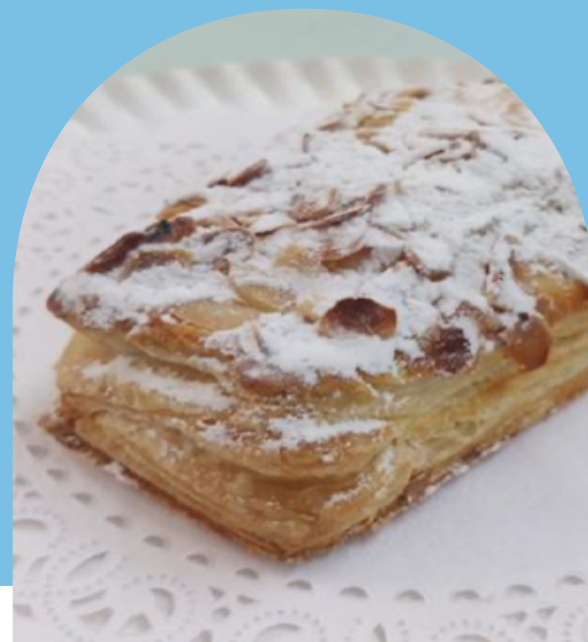
PALOMA RELLENA DE QUESO PHILADELPHIA