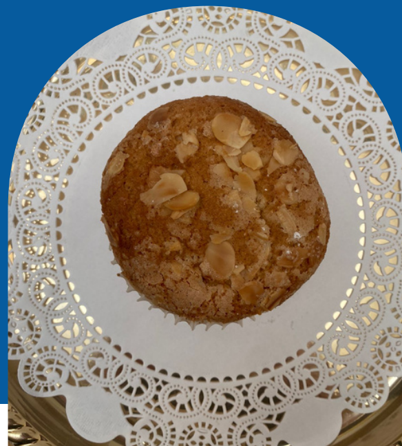
QUEPE DE ALMENDRA