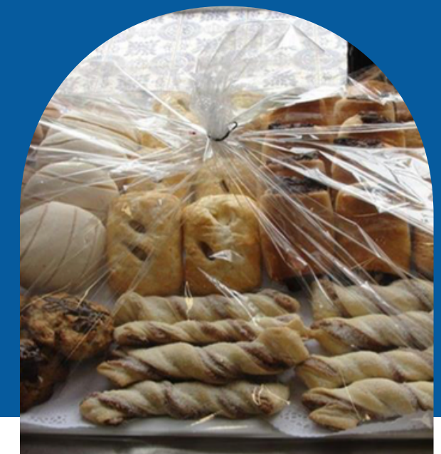
PAN MINI, CONCHA, ATE CON QUESO, BROCA, CHOCOLATÍN, ETC