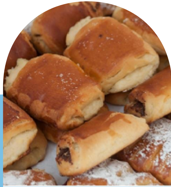
MONEDERO DE CREMA PASTELERA CHOCOLATÍN