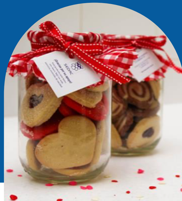
FRASCO DE GALLETAS