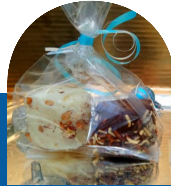
BOMBONES CUBIERTOS CON CHOCOLATES