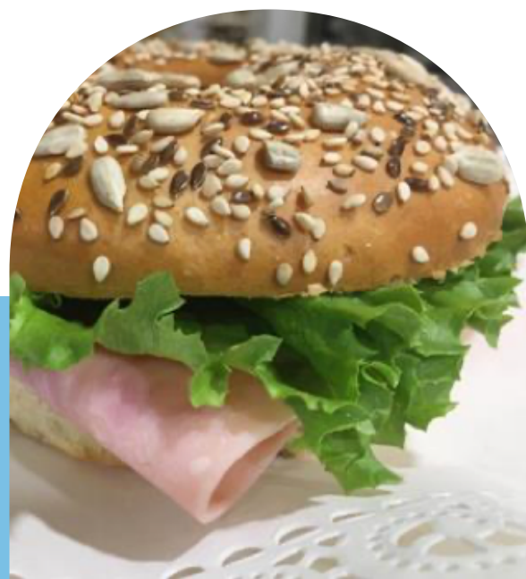
BAGEL RELLENO DE JAMÓN