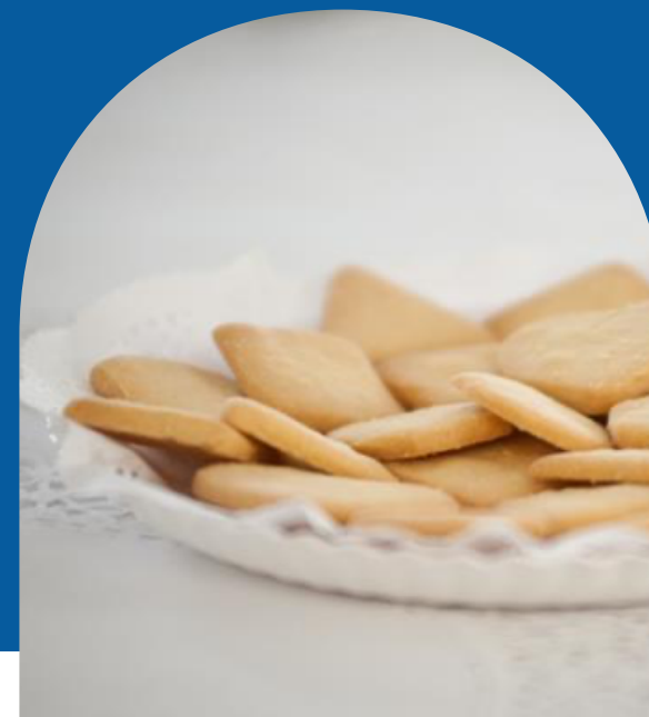
GALLETA DE MANTEQUILLA