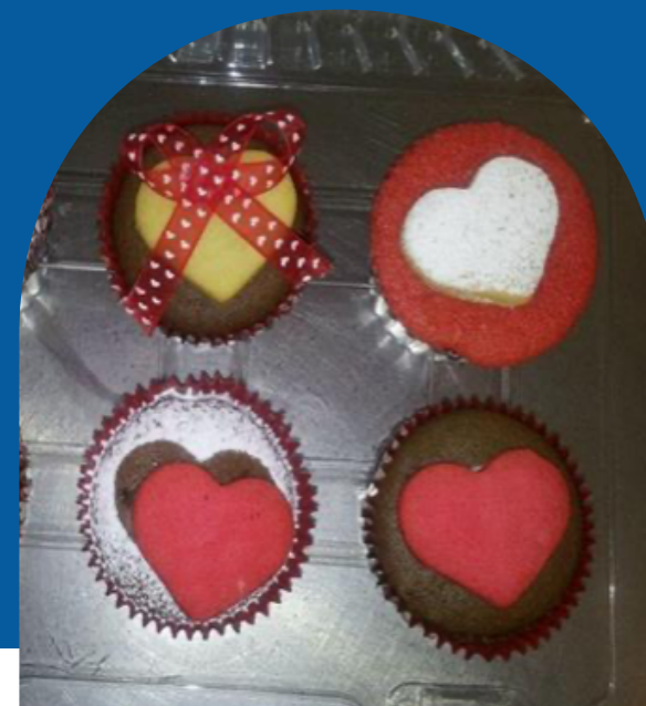
CUPCAKE EN FORMA DE CORAZÓN