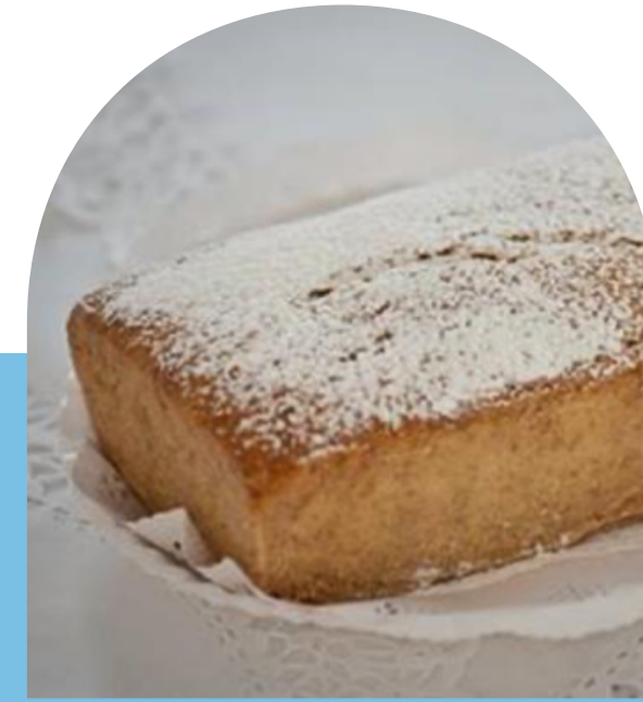
PANQUÉ DE NARANJA