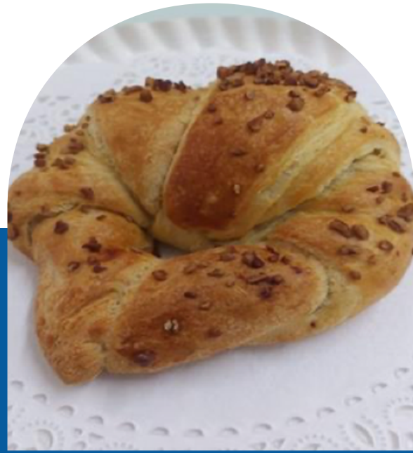
CUERNO CON HIGO