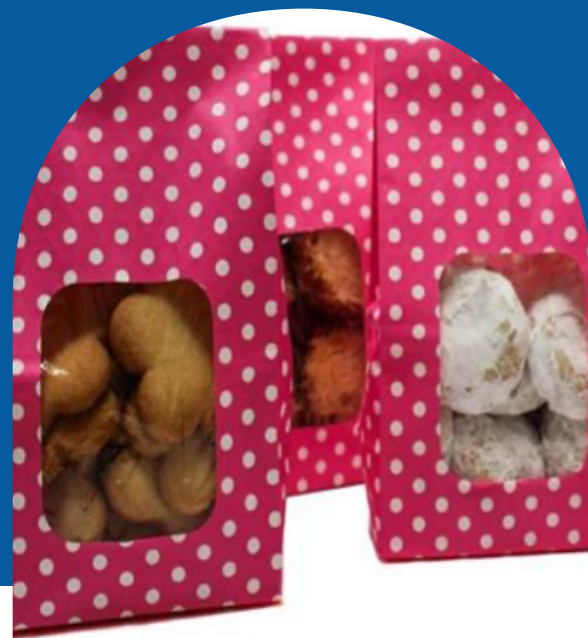
BOLSA DE GALLETAS