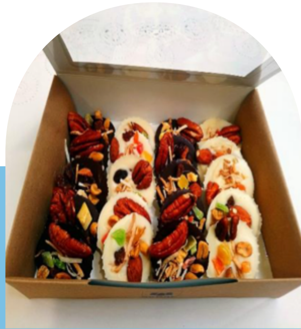
CAJA DE CHOCOLATES, FRUTOS SECOS Y GALLETAS