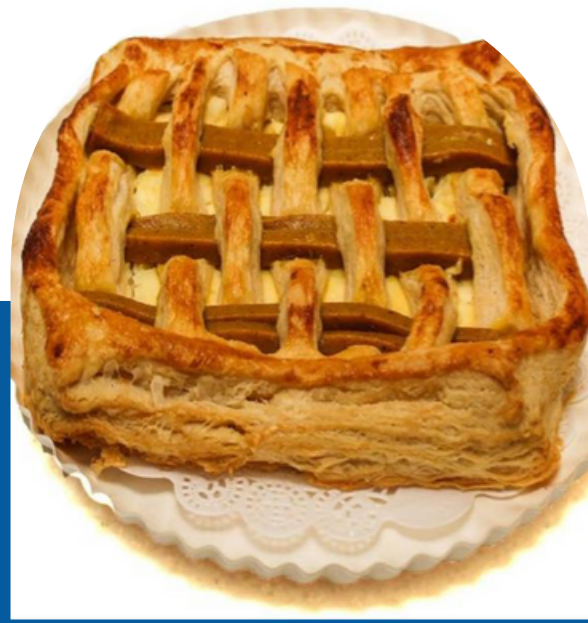
ATE CON QUESO