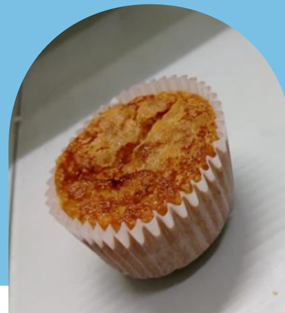
PANQUÉ DE ELOTE