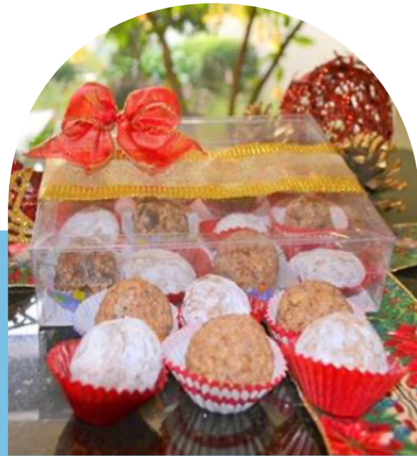
BOLITAS DE NUEZ