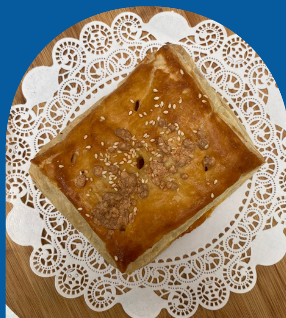
REJAS DE PEPERONI