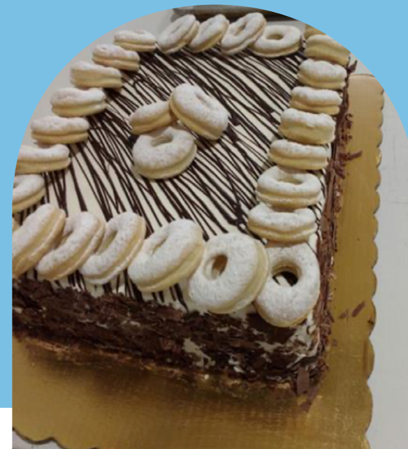
PASTEL MIL HOJAS