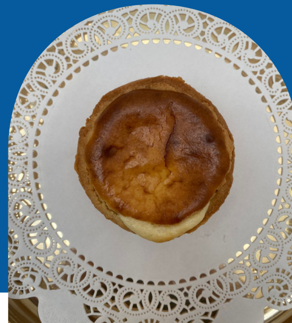
CUBILETE DE QUESO