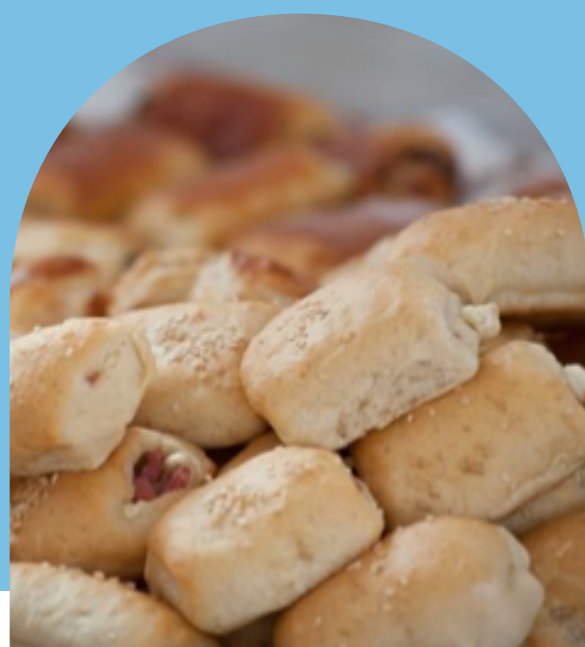
ROLLOS DE JAMÓN CON QUESO